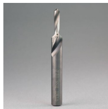
Foret étagé 90°

Pour emboutir facilement les bouchons cache-vis