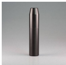
Outil de pose pour bouchon Polyéthylène